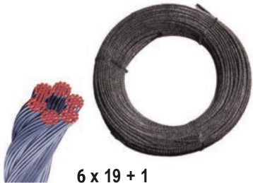
6 x 19 + 1